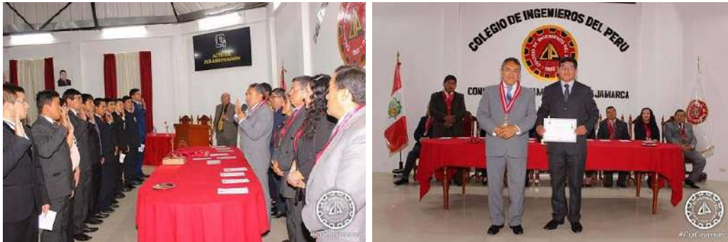
Ceremonia de Colegiatura mes de enero 2020