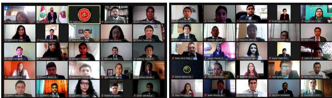
Ceremonia de Colegiatura mes de noviembre 2020