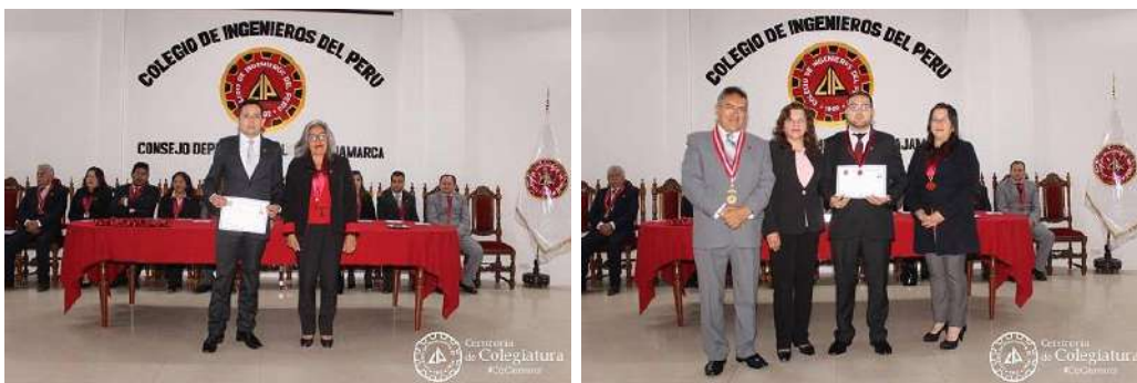
Ceremonia de Colegiatura mes de febrero 2020

Luego de haber iniciado la pandemia se realizaron 02 ceremonias virtuales de colegiaturas, incorporándose 401 nuevos agremiados, la primera